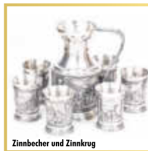
Zinnbecher und Zinnkrug