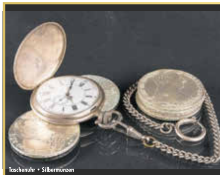
Taschenuhr • Silbermünzen

Schmuckkuschatullen zu kramen. Selbst Bernstein genießt aufgrund hoher Nachfrage im fernen Osten seinen persönlichen Höhenflug. Oft sogar als „langweilig“ oder „aus der Mode gekommen“ abgestempelt, könnte sich jetzt Bernsteinschmuck als große finanzielle Überraschung entpuppen. Für besonders schöne Honigbernsteinketten, im Idealfall in Oliven- oder Kugelform, kann