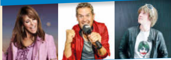
Ireen Sheer, Peter Wackel und Mickie Krause