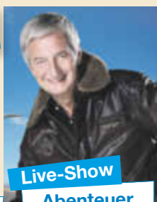
Live-Show Abenteuer Weltumrundung

Ausführlicher Reiseverlauf unter: www.schlagernacht-namibia.de