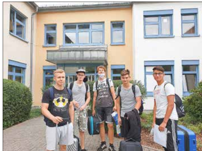
Rover vor der Jugendherberge Es geht auch ohne Leiter*innen. Gut so!