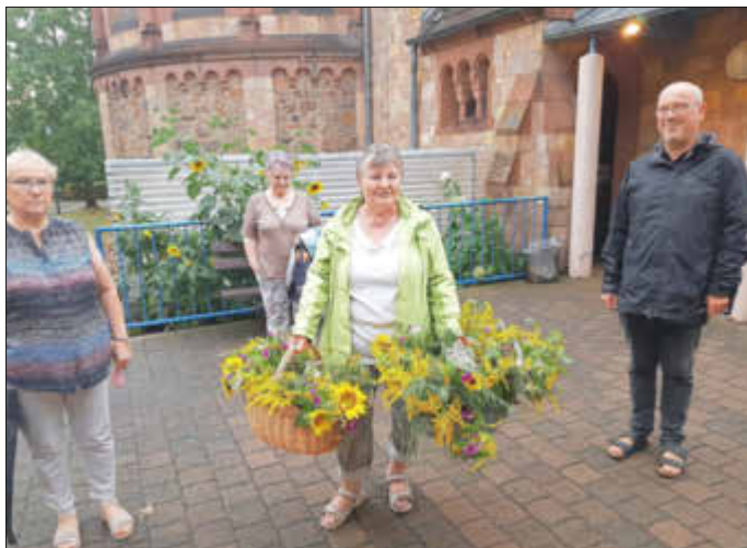
Kräuter- Geruch des Lebens!

Dieser Blick auf die Heilkraft der Schöpfung kann uns ermutigen, denn es gibt Heil für Leib und Seele - schon heute!