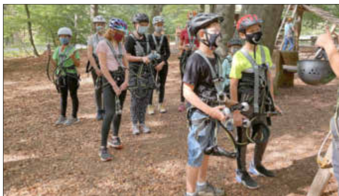
Kletteraktion der Ministranten Hier kommt der Pfarrbrief!