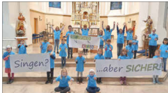
Die SoundKids bedanken sich von Herzen beim Gau-Bickelheimer Kindersachen-Basar-Team für die großzügige Spende zur Beschaffung der neuen Chor-Shirts.