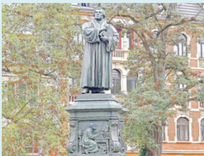
Martin Luther Denkmal in Eisenach

Der Reformationstag wird von den evangelischen Christen in Gedenken an die Reformation der Kirche durch Martin Luther gefeiert.