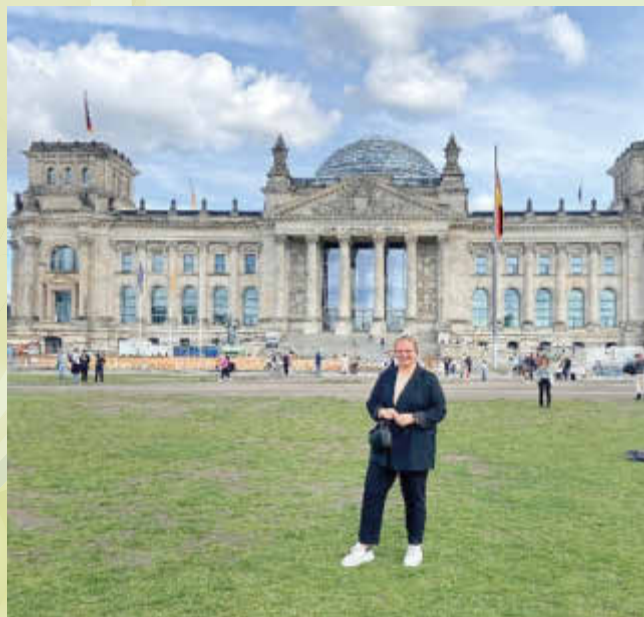
Einladung nach Berlin