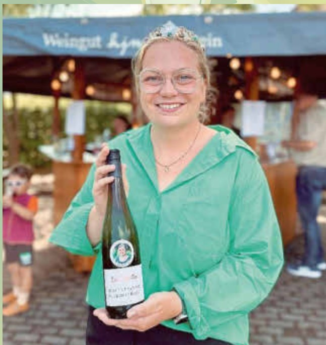
Wöllsteiner Markt im September 2022