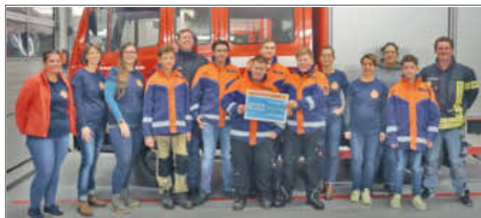
Übergabe der Spende von Herbstkindersachenbasar

Liebe Mitbürgerinnen, liebe Mitbürger, im letzten Herbst durften wir nun nach fast zweijähriger Corona-Pause wieder unseren beliebten Kindersachenbasar in Gau-Bickelheim planen. Wie in den vorherigen Jahren konnten wir uns über viele Anbieter, reichliches Kuchenbuffet und viele Besucher freuen. So konnte unser Team am 16.11.2022 eine Spende im Wert von 500,00€ an die Jugendfeuerwehr in Gau-Bickelheim überreichen. Wir bedanken uns bei allen, die aktiv mitgewirkt haben.