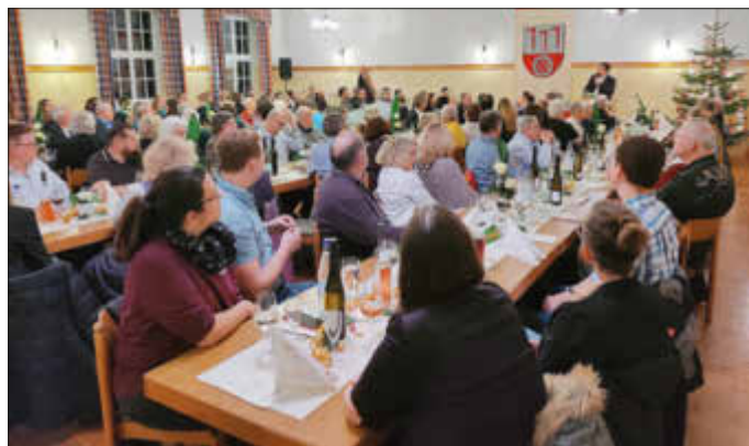
Neujahrsempfang der Ortsgemeinde 2023

Corona als Bremse vieler Vorhaben, die Ukraine-Krise - die eine Welle der Hilfsbereitschaft auch in Gau-Bickelheim auslöste, aber auch der Kita-Neubau mit seinen Höhen und Tiefen, Brandschutz in Bestandskita und Turnhalle, der Ausbau der B420 als Dauerbrenner, das neue Klo an der Kapelle, das geplante Baugebiet, neue Bestattungsformen auf dem Friedhof und das Freizeitgelände hinter dem Sportplatz - Bunt gemischt waren die Themen.