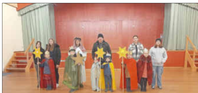
Sternsinger*innen in Stein-Bockenheim

3. Ökumene: Da die Christ*innen immer weniger werden, ist schon das ein Grund, endlich mehr Ökumene zu fordern und zu leben. Besuchen Sie den Gottesdienst zum Bibelsonntag in Wöllstein am 29. 1. um 17 h in der ev. Kirche. Sie sind jederzeit auch eingeladen, uns ihre Wünsche zur Ökumene mitzuteilen.