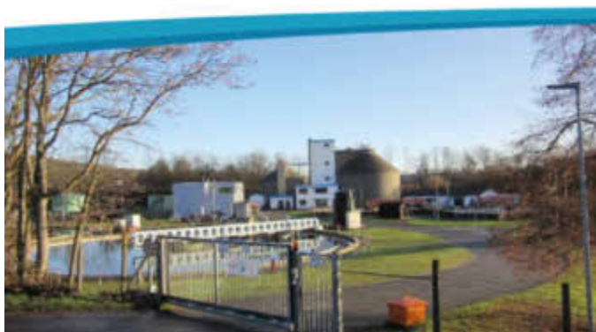
Im Bereich Kläranlage, Ausbaugröße 80.000 EGW, unseres Eigenbetriebes Stadtwerke ist die Stelle einer