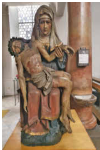
Pietà in Furfeld

Mit Maria unterwegs sein, die Freud und Leid der Menschheit teilt, ist ein wesentlicher Teil unseres Glaubens. So wollen wir auch in diesem Jahr wieder unsere Wallfahrt nach Marienthal durchführen.