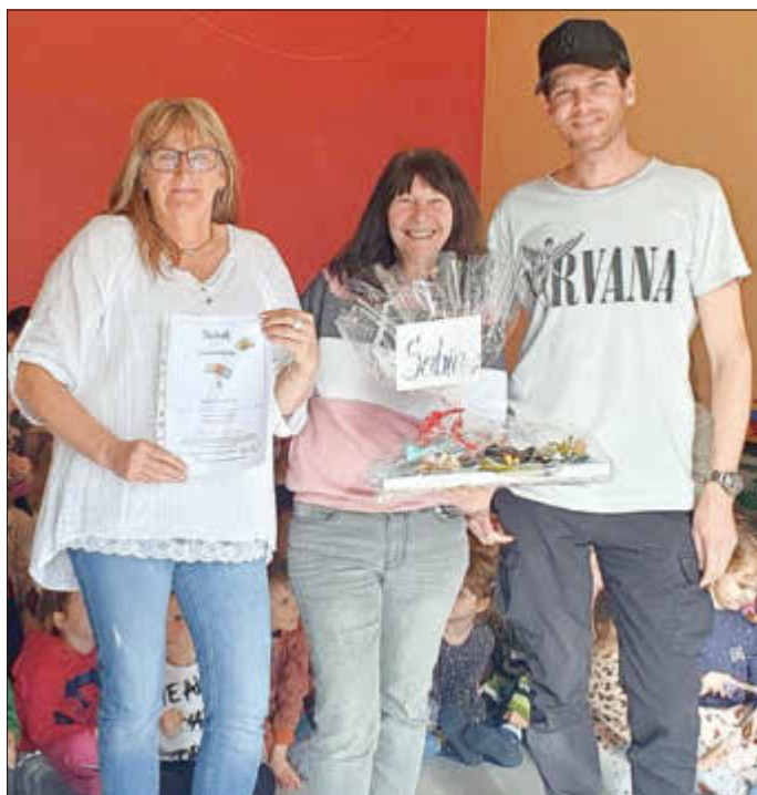
Freude über die Abschiedsgeschenke