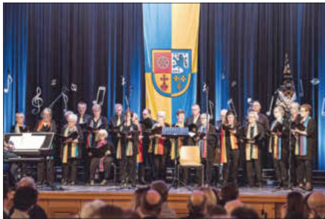
Kath. Kirchenchor Cäcilia