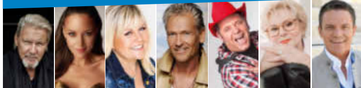
Johnny Logan, Jasmin Wagner/Blümchen, Gaby Baginsky, Olaf Berger, Markus Becker, Peggy March und Stefan Mross