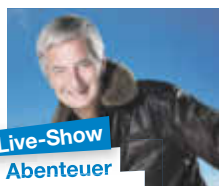
Live-Show Abenteuer Weltumrundung