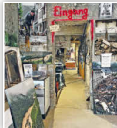
... die außer vielen Bildern auch mehrere Filmsequenzen beinhaltet.

AHRTAL. AFI. Auch fast zwei Jahre nach der verheerenden Flut ist das Ausmaß der Schäden entlang der Ahr weiterhin gegenwärtig. An vielen Stellen sieht es auf den ersten Blick noch immer nicht danach aus – doch es geht voran. Inhaber von Hotels, Restaurants und Geschäften haben, samt ihrer Mitarbeiter*innen, unzählige Stunden Arbeit, verbunden mit viel Hoffnung und Mut, in den Wiederaufbau ihrer geschäftlichen Existenzen gesteckt. Das Ziel: Endlich wieder zahlreiche Tages- und Übernachtungsgäste sowie Kundinnen und Kunden begrüßen zu können. Wanderfreudige Besucher*innen des Ahrtals dürfen sich, neben unvergesslichen Stunden in grandioser Natur entlang