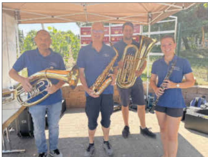
CMV Neu-Bamberg mit der Möglichkeit einmal Instrumente auszuprobieren