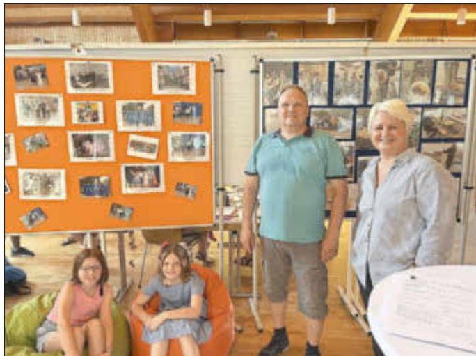
Förderverein der Wöllsteiner Schulen verkaufte selbstgemachte Marmelade

Am Sportstadion zeigte der TuS Wöllstein die Bandbreite des sportlichen Angebots, im Außenbereich konnte bei der Freiwilligen Feuerwehr ein echtes Feuer gelöscht werden und beim Team des Bürgerbus Hiwwelhopper wurde für neue Mitstreiter geworben.