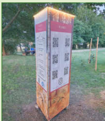
Die Tafel mit allen Informationen zu den Besonderheiten in der Region