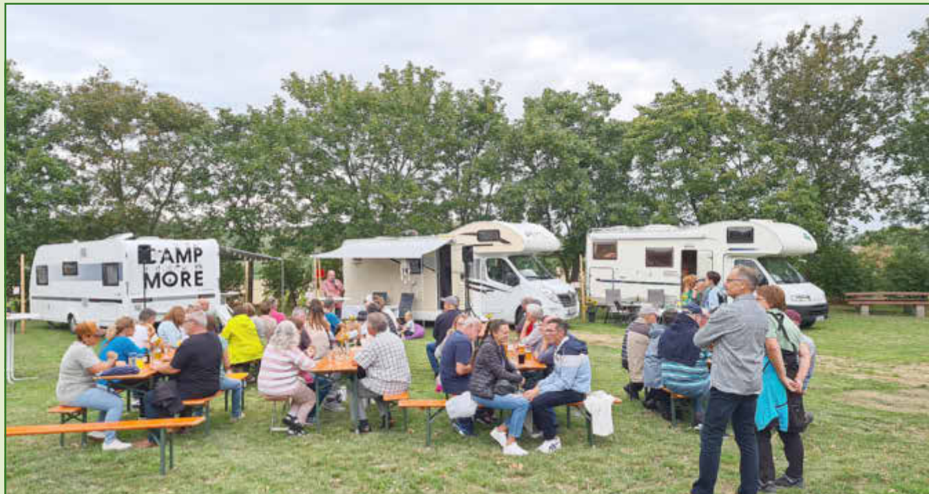
Ein Blick auf den Wohnmobilstellplatz „Wingertsknorze“