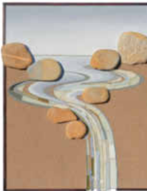
Titel des Bildes: Alles fließt

Die vom Bund Bildender Künstler und dem Ministerium für Kultur veranstaltete Aktion bietet allen Interessierten die Möglichkeit, Kunst dort zwanglos zu betrachten und näher kennen zu lernen, wo sie entsteht – beim Künstler zuhause oder/und in seinem Atelier.