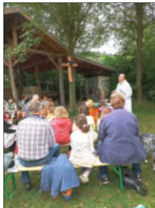
Messe im Pfadfindertag in Tiefenthal

7. Zeltlager der Pfadfinder: Wir danken dem Angelverein in Tiefenthal, dass wir wieder das schöne Gelände des Vereines für unser Sommerlager nutzen durften. Ein großes Lob auch allen Erwachsenen, die die Kinder und Jugendlichen vor Ort betreut haben und das tolle Programm geboten haben: Keltendorf, Kanufahrt, Rheinwelle, Tageswanderung und Radtour – um die Highlights zu benennen!