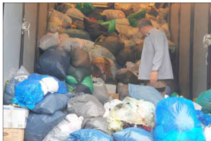
Tiersegnung und Kleidersammlung