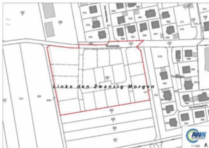
Karte: Gebiet „Links den Zwanzig Morgen“

Mit der betriebsfertigen Herstellung der öffentlichen Abwasseranlagen ist der Anschluss- und Benutzungszwang gem. § 7 und 8 der Allgemeinen Entwässerungssatzung wirksam geworden.