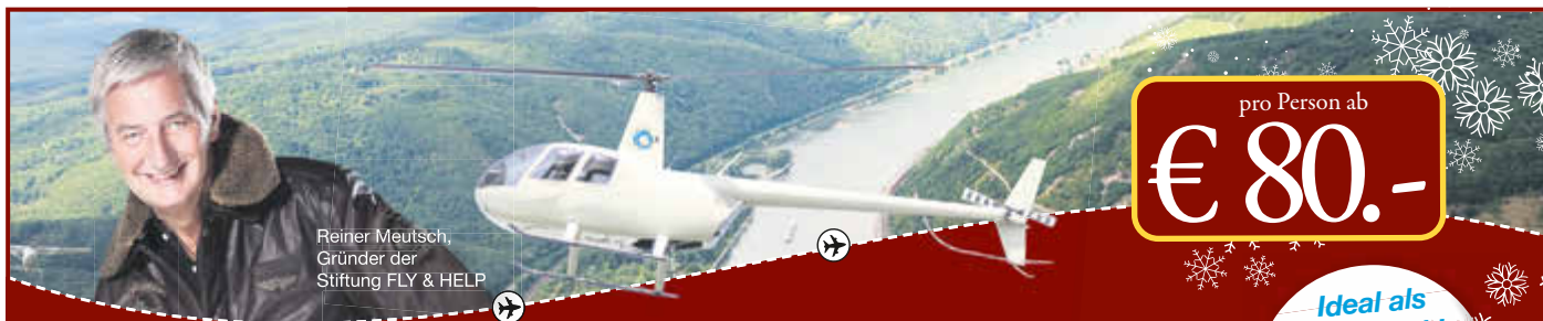
Reiner Meutsch, Gründer der Stiftung FLY & HELP